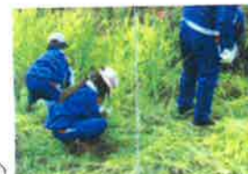
(教育キャンプ) (いもほり) (いねかり)